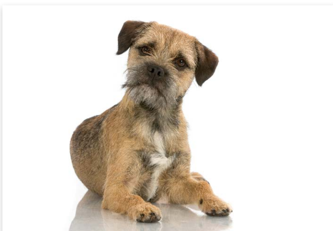
Juiste antwoord april: Border Terrier

Op onze Facebook-pagina kunt u iedere eerste dag van de maand meedoen aan het spel 'Raad het Ras'. In samenwerking met Kynoweb plaatsen we een vertroebelde foto van een rashond en u moet raden om welk ras het gaat. Onder de inzenders van het goede antwoord wordt iedere maand een boek verloot: 'Fokken van rashonden' of 'Handboek Kynologische Kennis 1'.